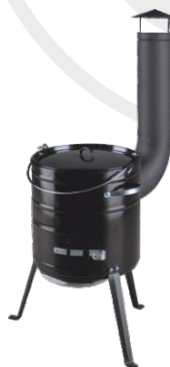
Smaltovaná kotlíková souprava 15 l