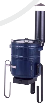
Smaltovaná kotlíková souprava 8 l