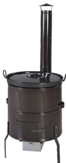
Smaltovaná kotlíková souprava 60 l

Ohřivač se skládá ze dvou samostatných celků - spodní část s ohništěm a těleso kotle s vodou a vyústěním kouřovodu (DN 120). Celý povrch ohřivače je proveden ve velmi trvanlivém smaltu. Otvor v horním lemu nádoby je určen k zasunutí hadice a napuštění vody do ohřivače bez nutnosti zvednutí pokličky.